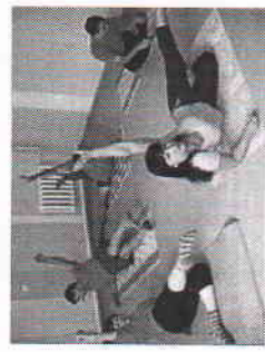
Занятие в спортивном зале