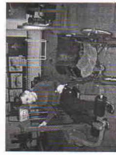
Занятия в тренажерном зале УСК "Старт"